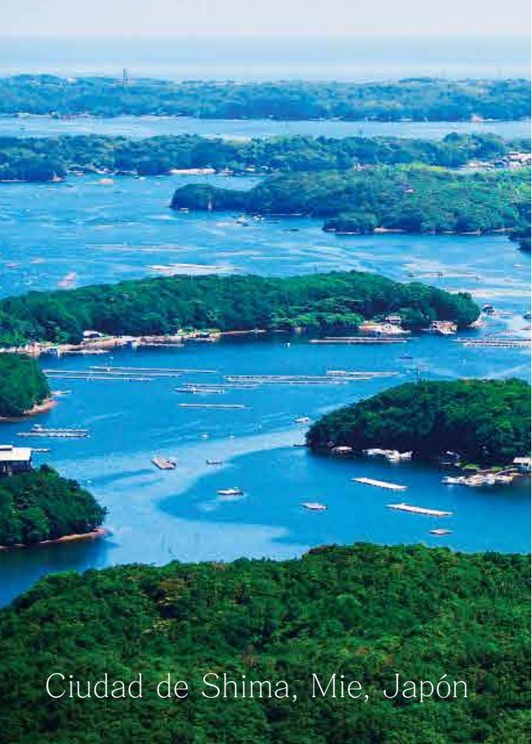
Ciudad de Shima, Mie, Japón